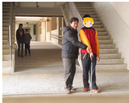
訓練正確使用手杖姿勢