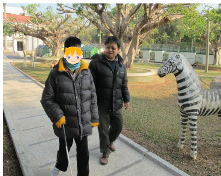
人車分道行走訓練