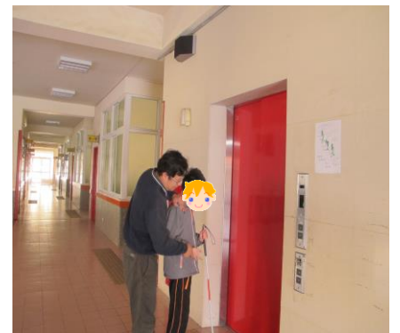
教導電梯使用技巧