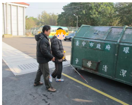
教室至垃圾車路徑手杖行走