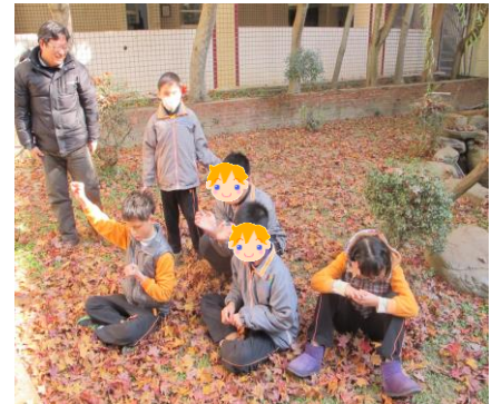
宿舍至教室之徒手訓練