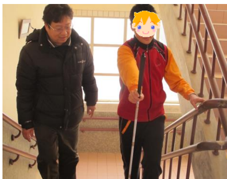
班級協同上下樓梯訓練