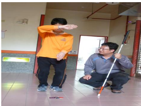
教導落地物撿物技巧